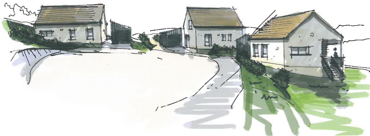
Perspective depuis la rue