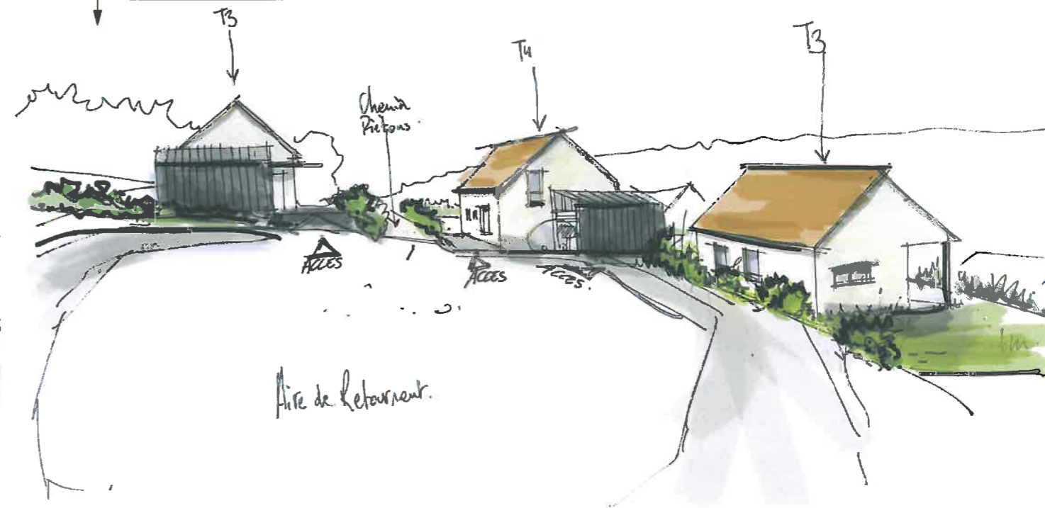
Perspective depuis la rue - Variante

MAITRE D'OUVRAGE Nièvre Habitat 1, Rue Emile Zola - B.P. 56 58020 - NEVERS CEDEX