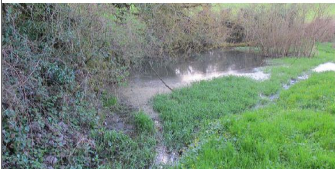
Illustration 13 : Vue de la mare Varzy-5 en avril 2013