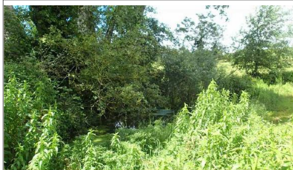
Illustration 14 : Vue de la mare Varzy-5 en juin 2016

La mare est très envasée (environ 1,20 m mesurés) donc un curage est indispensable sur les 2/3 de la surface (30 m 2 a minima avec curage sur 1 m d'épaisseur environ) notamment dans la partie est de la mare, avec arrachage de l'ensemble des ligneux (attention aux murets et dalles) . Le curage doit s'effectuer de façon hétérogène. La partie ouest est totalement envahie par l'Épilobe hirsute. Une partie sera à enlever lors du curage. Si les peupliers sont inclus sur la parcelle communale, une coupe partielle peut être opérée. Les rémanents devront être exportés après les avoir laissés quelques jours en petits tas au bord de la mare.