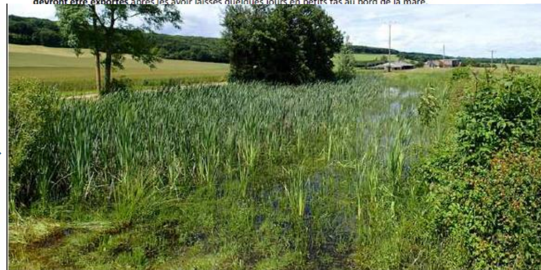
Illustration 22 : Vue de la mare Varzy-3 en juin 2016

Suite aux travaux de 2014, la végétation tend à recoloniser le milieu mais l'équilibre surface en eau libre / colonisation par la végétation reste encore satisfaisant. A moyen terme (3 à 5 ans estimés en fonction de l'évolution de la mare) une nouvelle intervention sera peut-être à programmer. Pour rappel, la pose d'une clôture autour de la mare est prévue.