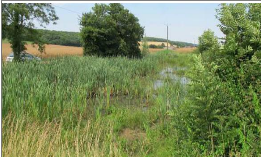
Illustration 21 : Vue de la mare Varzy-3 en juillet 2015, après les travaux de décembre 2014